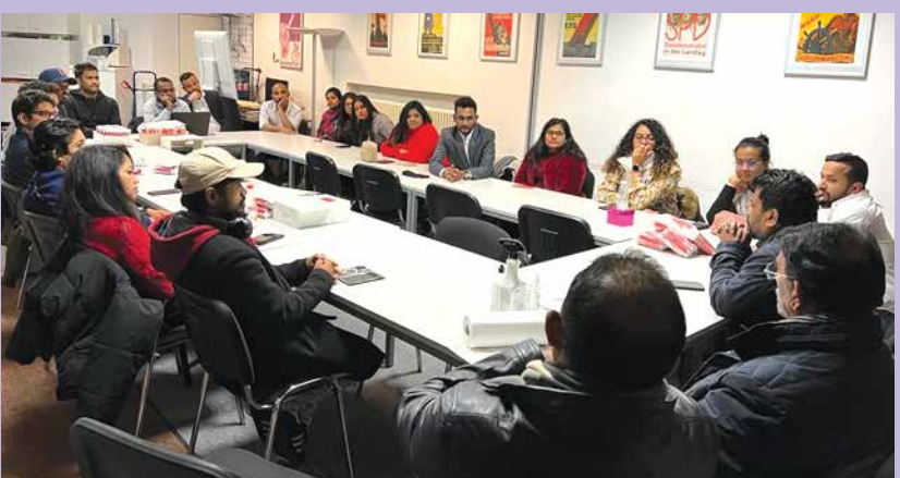
ජර්මනියේ ශ්‍රී ලාංකික සිසුන් සමග