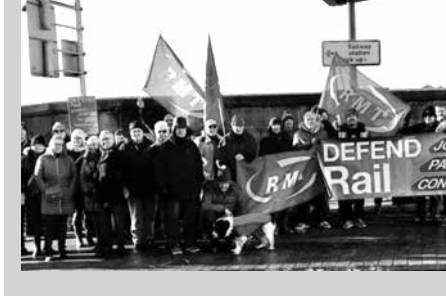
ප සු ගී ය දෙසැම්බර් 13, 14 සහ 16, 17 දිනයන්හිදී බ්‍රිතාන්‍ය දුම්රිය සේවකයෝ සාධාරණ වැටුප් වැඩිවීමක් ඉල්ලා

වැඩ වර්ජනයක නිරත වූහ. ඊට නායකත්වය දුන්නේ දුම්රිය නොකා හා ගමනාගමන කම්කරුවන්ගේ ජාතික සංගමය මගිනි. එම වැඩවර්ජනයට දුම්රිය මෙහෙයුම් සමාගම් දාහතරක් නියෝජනය කරමින් 40,000 පමණ පිරිසක් එක්ව සිටියහ.