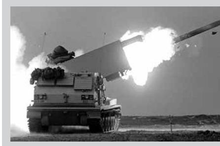
2020 වසරට සාපේක්ෂව 2021 වසරේදී ලෝකයේ ආයුධ අලෙවිය 1.9% කින් ඉහළ ගොස් ඇතැයි ස්ටොක්හෝම්

ජාත්‍යන්තර සාම පර්යේෂණායතනය සිය නවතම වාර්තා මගින් හෙළිදරව් කර තිබේ. ලෝකයේ ආයුධ වෙළඳාමේ ප්‍රමුඛයා වී සිටින්නේ එක්සත් ජනපදයයි. ලෝක ආයුධ වෙළඳාමෙන් 50%ක් සිදු කරන්නේ එක්සත් ජනපදය වන අතර ලෝක ආයුධ වෙළඳාමෙන් සියයට 18%ක් චීනයද 6.8%ක් බ්‍රිතාන්‍යය විසින්ද සිදුකරනු ලබයි.