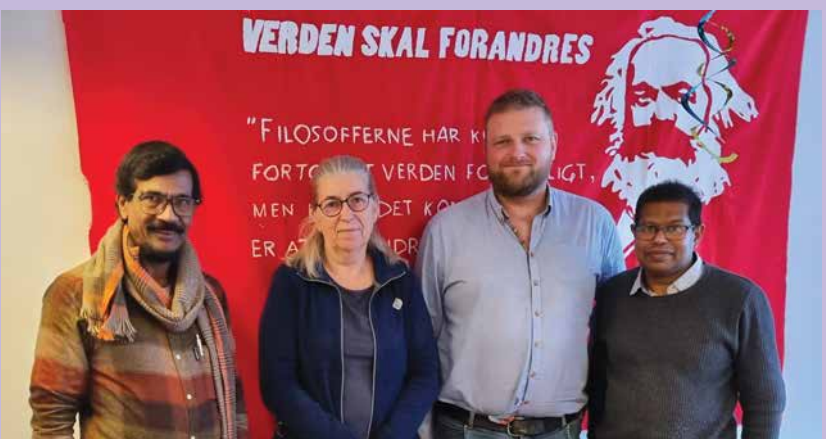
ස්වීඩනයේ වාමාංශික පක්ෂ හමුවී