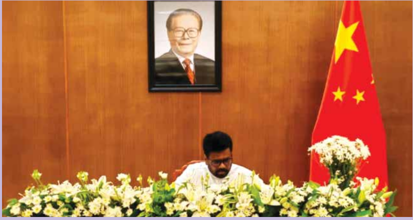
චීනයේ හිටපු ජනපති විශ්වවට සොව පළකර