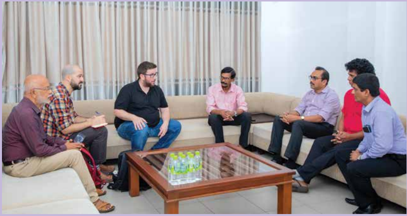
ස්ථානීයයන්ගේ වාමාංශික පක්ෂ නියෝජිතයින් මුණාගැසී