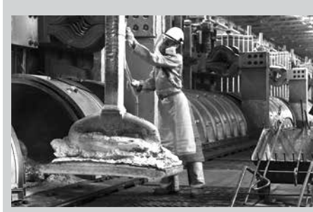
රුසියාව, යුරෝපය හා එක්සත් ජනපදය වෙත කෙරෙන ඔවුන්ගේ ලෝහ නිෂ්පාදන අපනයනය නවකා දැමීමට

තීරණය කර තිබේ. ඒ වෙනුවට රුසියාව සිය නිෂ්පාදන විනය, තුර්කිය, ගිනිකොන දිග ආසියානු රටවලට සහ ලතින් ඇමරිකානු, අප්‍රිකානු රටවලට අපනයනය කිරීමට තීරණය කර තිබේ. එක්සත් ජනපදය හා යුරෝපය විසින් රුසියාවට පනවා ඇති සම්බාධක ඊට හේතුවයි. රුසියාව ලෝකයේ විශාලතම ලෝහ නිෂ්පාදනය කරන රටවල් අතුරින් එකකි. ලෝක ටයිටේනියම්ල නිෂ්පාදනයෙන් 13%ක්, නිකල් නිෂ්පාදනයෙන් 11.2%ක්, ජලාලිත නිෂ්පාදනයෙන් 10.5%ක්, ඇලුමිනියම් නිෂ්පාදනයෙන් 5.4%ක් තඹ නිෂ්පාදනයෙන් 4% ක් සිදුකරන්නේ රුසියාවයි.