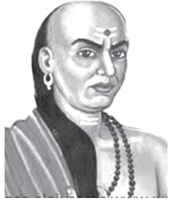
"ඔබ සාධාරණ නිසා ලෝකය ඔබට සාධාරණ වනු ඇතැයි සිතන්නේනම් ඔබ ඔබවම මෝඩයෙක් කර ගනී. එය හරියටම ඔබ සිංහයන් හොකන නිසා සිංහයන් ඔබට හොකනු ඇතැයි බලාපොරොත්තු වීම වැනිය."

සෞඛ්‍ය පහසුකම් අවශ්‍ය වන්නේ අසනීප වූ අයට මිස අනම්ම මුදල් ඇතිව අසනීප වන අයට පමණක් නොවේ. දැන් මේ පුද්ගලිකරණයේ අවසාන අදියරේ සෞඛ්‍යය විකිණීමට උත්සාහ දරන්නේ මුදල් ඇති අයට පමණක් අසනීප වීමට හැකියාව ඇති කර අනික් ජනතාවට මිස යාම තෝරා ගැනීමටය. නමුත්, අවශ්‍ය වන්නේ වෙළඳපොළේ විකිණීමට නිදහස ඉක්මවා යන සාමාන්‍යතාවය සලකන පොදු ජනතාවට සේවයක් සහිත සෞඛ්‍ය සේවාවකි. අධ්‍යාපනයටද