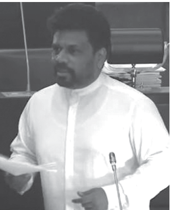
කොතනටද ගිහින් තිබෙන්නේ. ව්‍යාපාරිකයන් විශාල පිරිසක් සියදිවි නසා ගැනීමේ තත්වයට නැත්නම් ගැටුම් ඇතිවීමේ තත්වයකට පත්කර තිබෙනවා. පරණ දේපළ පවරා ගැනීමේ ක්‍රියාදාමය බැංකු විසින් වෙනස් කරන්න ඕනෑ. මංකොල්ලකාරයෝ පාර්ලිමේන්තුවේ ඉන්නවා. මම කතා කරන්නේ පිරිසිදු ව්‍යාපාරිකයන් ගැනයි. ආර්ථිකයේ කඩා වැටීම නිසා

වැටෙනවා. සෑපු හා වක්‍ර රැකියා ලක්ෂ හතක් පමණ මේ වන විට අහිමිවී තිබෙනවා. මේසත් බාස්ගේ සිට සිවිල් ඉංජිනේරුවා දක්වා රැකියා අහිමිවී තිබෙනවා. මේ ව්‍යවසායකයන්ට ණය සහන කාලයක් දෙසැම්බර් දක්වා ලබාදුන්නා. ජනවාරි සිට සිදුවන්නේ මොකක්ද? ඉඩකඩම් පවා අහිමි වී බැංකුවලට පවරා ගැනීමේ අනතුරක් තිබෙනවා. මේ කර්මාන්තවලින් යැපෙන සියලුම පවුල් විශාල කර්මාන්තවලට මුහුණ දෙනවා. මේ පිළිබඳව අවධානය යොමු කළ යුතුයි. කර්මාන්තකරුවන් අතරින් 1% - 2%ක් පමණ හිතා මතා ණය පැහැර හරින අය ඇති. අද කර්මාන්ත කඩා වැටෙන්නේ ඔවුන්ගේ ගැටලුවක් නිසා නෙමෙයි; පාලකයන් විසින් ඇති කළ ආර්ථික ප්‍රතිවිපාක නිසයි.