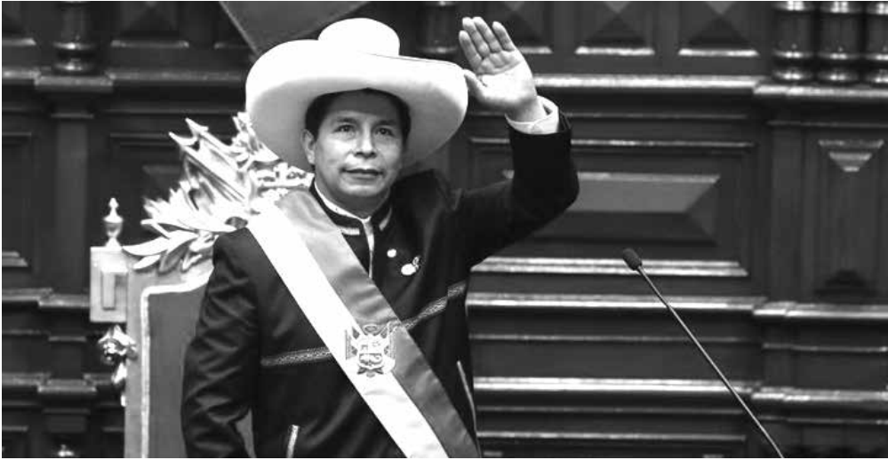
පෙච්ලෝ කැස්ට්‍රෝගේ ආගමනය හා කුමන්ත්‍රණයේ ගමන් මඟ

එක්සත් ජනපදයේ අනුග්‍රහය ඇතිව ක්‍රියාත්මක වූ කුමන්ත්‍රණයකට අනුව පසුගිය දෙසැම්බර් 7 වනදා පිරුහි ජනාධිපති පෙච්ලෝ කැස්ට්‍රෝ ජනාධිපති ධුරයෙන් පහ කර අත්අඩංගුවට ගන්නා ලදී. ඔහු ධුරයෙන් පහ කර අත්අඩංගුවට ගැනීමට පෙර දක්ෂිණාංශික බලයක් සහිත එරට පාර්ලිමේන්තුව විසින් ඔහුට එරෙහිව දෝෂාභියෝගයක් සම්මත කර ගන්නට සමත් විය. ඒ සඳහා පක්ෂව ඡන්ද 107ක් ලැබී තිබූ අතර විපක්ෂව ඡන්ද 06 ක් ලැබී තිබුණි. එකොළොස් දෙනෙකු ඡන්දය දීමෙන් වැළකී සිටි තිබුණි. ප්‍රගතිශීලී, අධිරාජ්‍යවාදී හා ව්‍යාධික නායකයකු බව පෙන්වූ කැස්ට්‍රෝ 2021 වසරේ ජුනි මස පැවැත්වූ ජනාධිපතිවරණයෙන් ජය ගෙන එම වසරේ ජූලි මාසයේ දී ජනාධිපතිවරයා වශයෙන් දිවුරුම් දීමෙන් පසු ගත වූ මාස 18ක කාලයේදී ඔහුට එරෙහිව දක්ෂිණාංශික පාර්ලිමේන්තුව විසින් ගෙනෙන ලද තුන්වන දෝෂාභියෝගය මෙයයි.