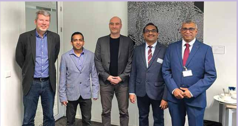
හෙදර්ලන්තයේ වාමාංශික පක්ෂ හමුවී