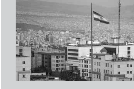
එළැඹෙන ජනවාරියේදී ඉරානය, යුරේසියානු අර්ථික සමග නිදහස් වෙළඳ ගිවිසුමකට

එළැඹීමට තීරණය කර තිබේ. යුරේසියානු ආර්ථික සංගමය 2015 වසරේ දී රුසියාව, බෙලාරුසියාව හා කසක්කානය එක්ව ගොඩනැගූ සංගමයකි. දැන් එයට ආර්මේනියාව හා කිරිගිසියාවද එක් වී සිටී. විශ්වාසනීය කලාපීය නොවන රටක් ලෙස ඊට සම්බන්ධ වී සිටී. මෙම ගිවිසුමක් සමග ඉරානයට වඩා පහසුවෙන් මෙම රටවල් සමඟ වෙළඳ ගනුදෙනු කිරීමට හැකියාව ලැබෙනු ඇත.