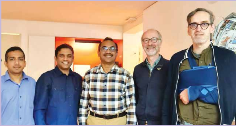
බෙල්ජියමේ වාමාංශික පක්ෂ හමුවී